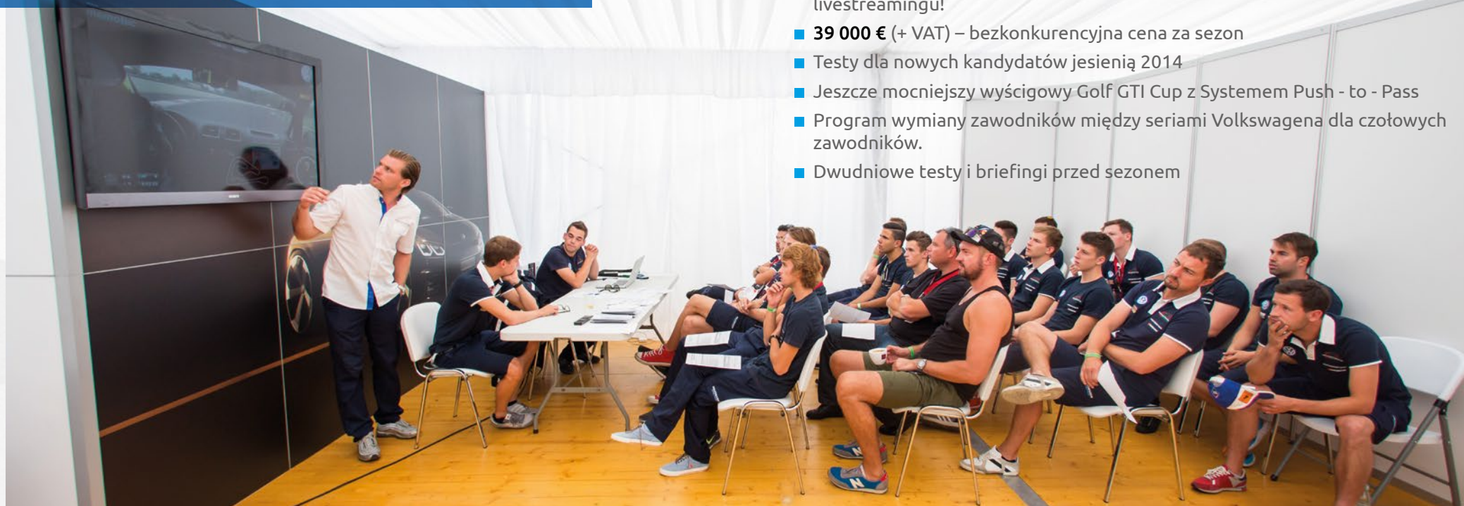
BRIEFINGI I SZKOLENIA