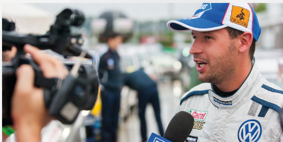
TRANSMISJE Z WYŚCIGÓW NA ŻYWO W INTERNECIE